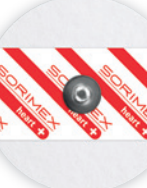
EK-S 55 PSG

Ø 55 mm żel stały pianka polietylenowa opak. jedn.: 50 szt. opak. zbiorcze: 1500 szt.