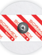
EK-S 50 PSG

Ø 50 mm żel stały pianka polietylenowa opak. jedn.: 50 szt. opak. zbiorcze: 1500 szt.