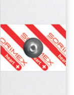
EK-S 56 P

55 x 35 mm żel ciekły pianka polietylenowa opak. jedn.: 50 szt. opak. zbiorcze: 1500 szt.