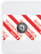
EK-S 44 PSG

44 x 30 mm żel stały pianka polietylenowa opak. jedn.: 50 szt. opak. zbiorcze: 2000 szt.