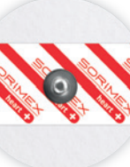
EK-S 50 P

Ø 50 mm żel ciekły pianka polietylenowa opak. jedn.: 50 szt. opak. zbiorcze: 1500 szt.