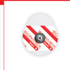
EK-S 42 PSG

42 x 36 mm pianka polietylenowa opak. jedn.: 50 szt. opak. zbiorcze: 2000 szt.