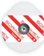
EK-S 45 PSG

45 x 42 mm żel stały pianka polietylenowa opak. jedn.: 50 szt. opak. zbiorcze: 1500 szt.